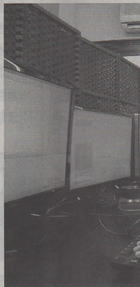
送電線工事に関わ

験、または試験に合格するなどして国に登録すれば測量業を行える【試験科目】法規・国際条約、測量方法、地図編集など筆記9科目