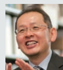
前野 隆司 [教授]